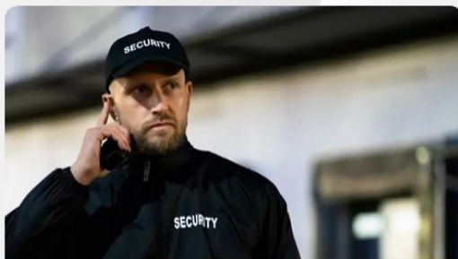
24/7 vor Ort Guard Einsatz