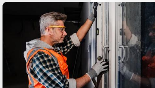
24/7-Notfallkontakt für Schadensabwicklung durch Zurich