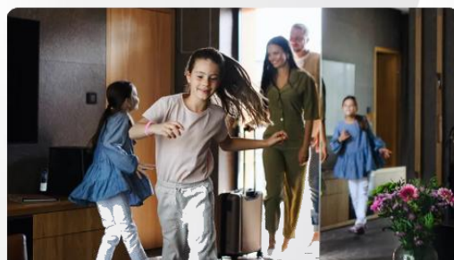
Geofencing – ein System, das denkt und handelt